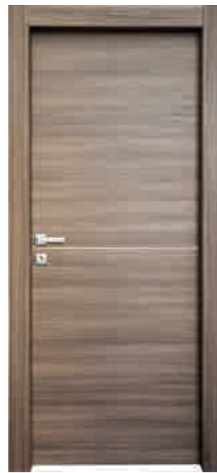
Inserto alluminio orizzontale