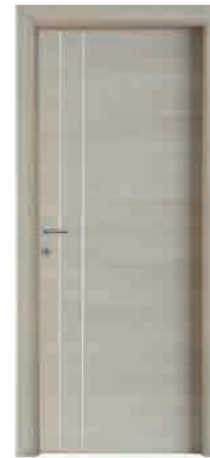
Inserti alluminio verticali