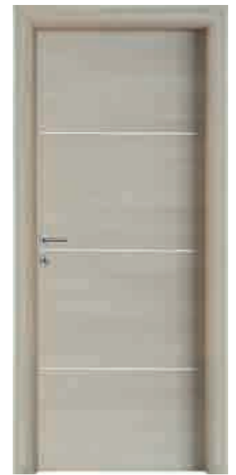
Inserti alluminio orizzontali